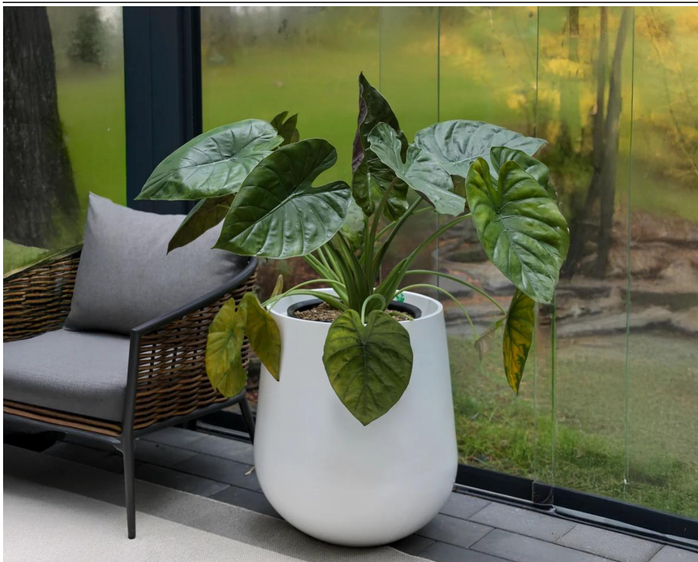
Duża biała matowa donica SQ65 bØ57x65 cm

Donica tarasowa SQ65 w kolorze biały mat ma 57 cm średnicy, 65 cm wysokości i 108 litrów pojemności.