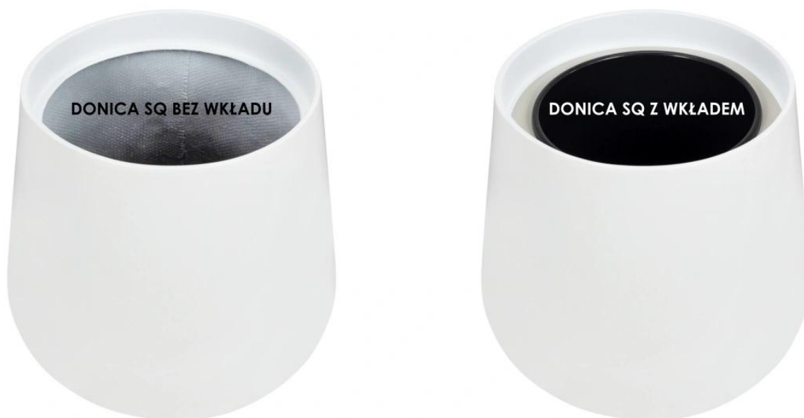
Donica SQ bez wkładu | Donica SQ z wkładem

Donica SQ65 stwarza nieskończone możliwości, szczególnie dzięki opcjonalnemu wymowanemu wewnętrznemu wkładowi o pojemności 13 litrów. Ten dodatkowy element znacząco poszerza zakres funkcjonalności, który oferuje model SQ65, wprowadzając nowy wymiar przyjemności w pielęgnacji roślin. To rozwiązanie otwiera pole do swobodnej i elastycznej wymiany roślin, umożliwiając tworzenie różnorodnych aranżacji wewnątrz, dostosowanych do indywidualnych gustów. Otwiera drzwi do eksperymentowania i kształtowania przestrzeni zgodnie z naszymi osobistymi preferencjami, co pozwala na tworzenie niepowtarzalnych kompozycji roślinnych, oddających w pełni naszą wyjątkową wizję estetyki.