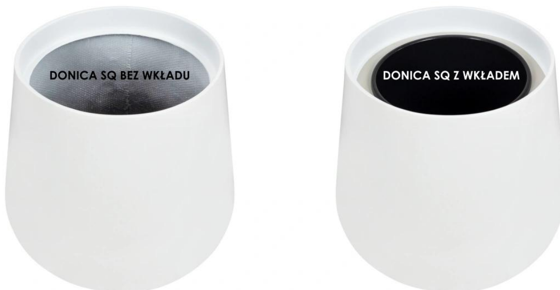
Donica SQ bez wkładu | Donica SQ z wkładem

Model SQ50 Ø48x50 cm , to jeden w rozmiarów kolekcji donic SQ , które dostępne są w czterech rozmiarach i kilku modnych kolorach. Wszystkie donice ZADORA Classic SQ to świetne rozwiązanie dla wszystkich, którzy cenią wygodę pielęgnacji roślin i estetyczny, surowy wygląd donic. Dostępność kilku rozmiarów i kolorów donic z serii SQ daje ogromne możliwości tworzenia kompozycji roślinnych dostosowanych do przestrzeni tarasu, salonu czy biura.