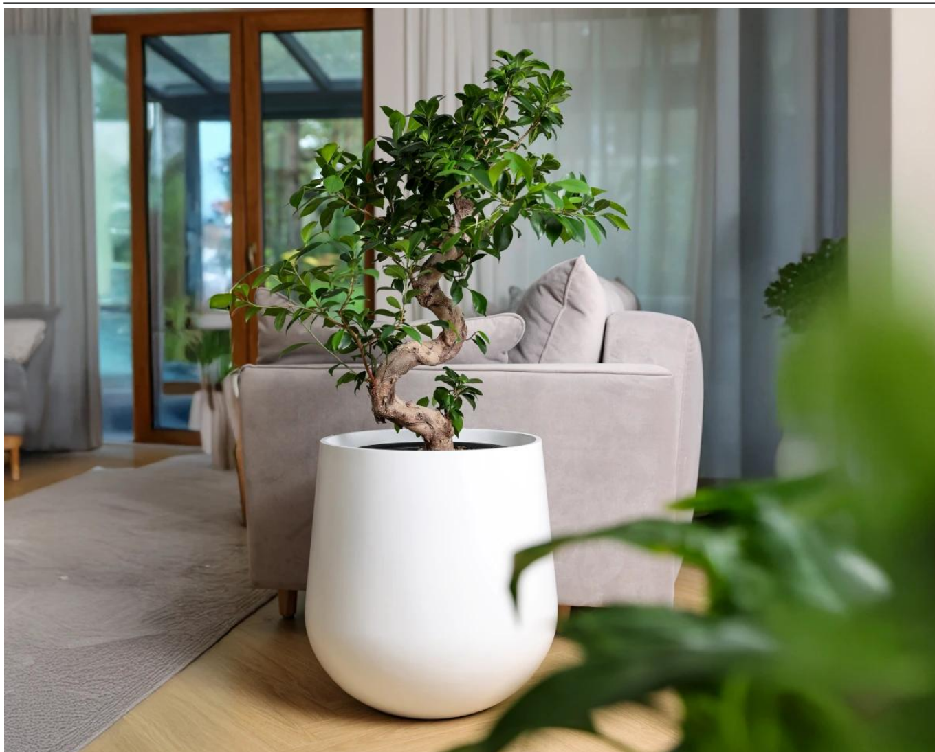
Donica ZADORA Classic SQ50 biały mat

BARTPOL Sp. z o.o. ul. Strzeszyńska 33 60-479 Poznań NIP: 6932050703 t. 61 661 61 78 t. 607 531 181