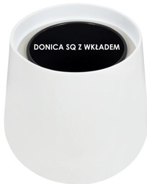
Donica SQ bez wkładu | Donica SQ z wkładem