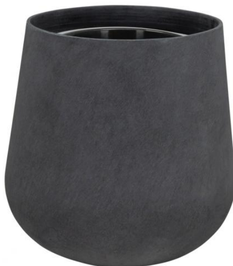
Doniczka SQ40 grafitowy beton - wersja z wewnętrznym wkładem

Wewnętrzny wymiowany 10 litrowy wkład to opcja dodatkowa dla donicy SQ40.