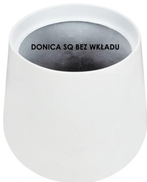
DONICA SQ BEZ WKŁADU

Donica SQ40 z wymiowanym wkładem o pojemności 10 litrów to wielofunkcyjne rozwiązanie. Ten opcjonalny dodatek znacząco zwiększa funkcjonalność donicy oraz ułatwia pielęgnację roślin. Dzięki niemu możemy wygodnie i elastycznie wymieniać rośliny, co umożliwia tworzenie zmiennych aranżacji wewnątrz zgodnie z naszymi upodobaniami. To daje nam swobodę do eksperymentowania, dostosowywania przestrzeni i kreowania unikalnych kompozycji roślinnych.