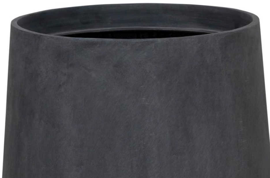
Wykończenie powierzchni doniczki SQ40 przypomina grafitowy beton architektoniczny

Doniczka ma zaokrąglony kształt oraz minimalistyczne, surowe wykończenie nawiązujące do charakterystycznego wyglądu betonu architektonicznego . Stanowi idealne uzupełnienie nowoczesnych trendów wystroju, zarówno w przestrzeniach mieszkalnych, jak i biurowych. Dzięki swojej wytrzymałości na działanie czynników atmosferycznych, doniczka SQ40 w antracytowym odcieniu betonu doskonale sprawdzi się również jako dekoracja na balkonach oraz tarasach.