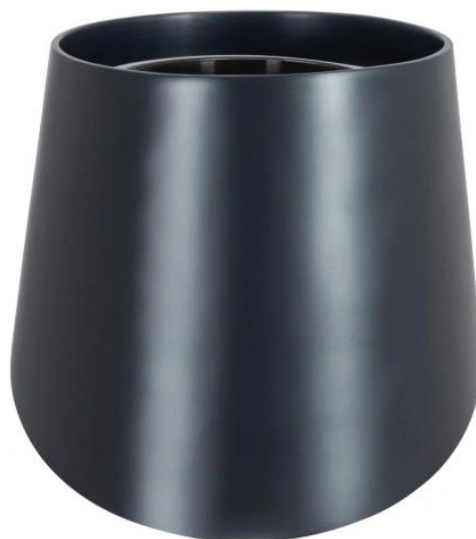
Doniczka SQ40 antracyt mat - wersja z wewnętrznym wkładem

Wewnętrzna wyjmowana donica o pojemności 10 litrów to opcja dodatkowa dla donicy SQ40.