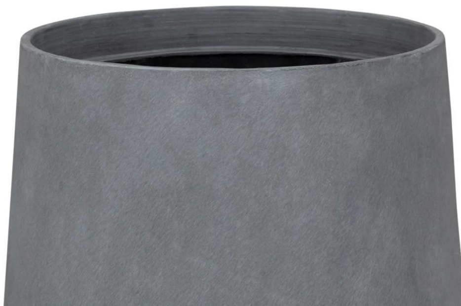
Wykończenie powierzchni doniczki SQ30 przypomina szary beton architektoniczny

Doniczka ZADORA Classic SQ30 w kolorze szarego betonu , wyprodukowana została z kompozytu włókna szklanego, żywicy poliestrowej i cementu. To unikalne połączenie materiałów sprawia, że doniczka jest bardzo lekka, odporna na warunki atmosferyczne i w 100% mrozoodporna. Szara wyglądająca jak betonowa powierzchnia doniczki posiada delikatną fakturę powierzchni doskonale imitująca beton architektoniczny. Obły kształt doniczki i minimalistyczne surowe betonowe wykończenie idealnie wpisują się we współczesne trendy wyposażania wnętrz mieszkalnych i biurowych. Odporność na działania czynników atmosferyczny pozwala również na wykorzystanie szarobetonowej doniczki SQ30 do dekoracji na balkonach i tarasach.