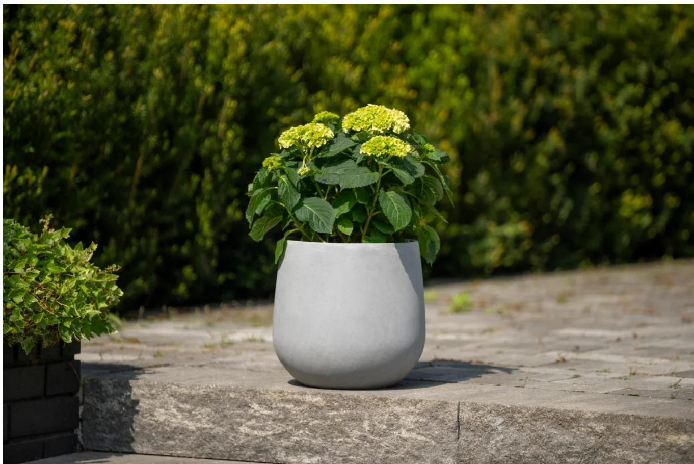
Hortensja w donicy SQ30 w kolorze szary beton

Planując wykorzystanie doniczki SQ30 na tarasie lub balkonie, pamiętaj aby wykonać w jej dnie otwory odpływowe , dzięki którym nie będzie się w niej gromadzić woda z opadów. Dzięki tym otworom doniczka SQ30 będzie również całkowicie odporna na mróz i bez obaw o jej zniszczenie, będzie mogła pełnić swoją dekoracyjną rolę na tarasie lub balkonie przez cały rok. Otwory bez trudu można wykonać samodzielnie przy użyciu wiertarki i wiertła o średnicy 10-12 mm. Poza wykonaniem otworów, zalecamy wsypanie na dno doniczki kilkucentymetrowej warstwy keramzytu. To kruszywo ceramiczne ma bardzo porowatą strukturę, która wchłania duże ilości wody, a następnie stopniowo uwalnia wilgoć do podłoża.