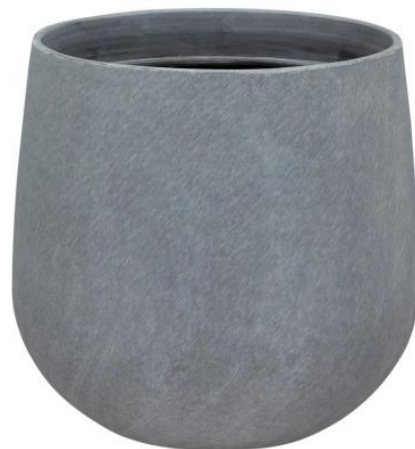
Wymiary doniczki SQ30 w kolorze szary beton

Lekka, trwała i odporna na uszkodzenia - doskonała do mniejszych roślin ozdobnych.