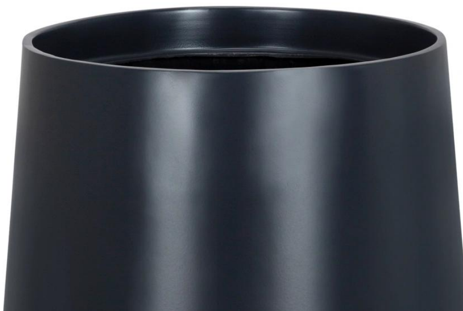
Gładka powierzchnia doniczki SQ30 w kolorze antracyt mat

Dzięki wyjątkowej wytrzymałości na działanie czynników atmosferycznych, grafitowa doniczka SQ30 staje się doskonałym elementem dekoracyjnym zarówno na balkonach, jak i tarasach.