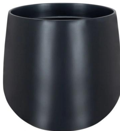
Wymiary doniczki SQ30 w kolorze antracyt mat

Doniczka SQ30 antracyt mat jest lekka, odporna na uszkodzenia i w 100% mrozoodporna - idealna jako doniczka na balkon lub taras.