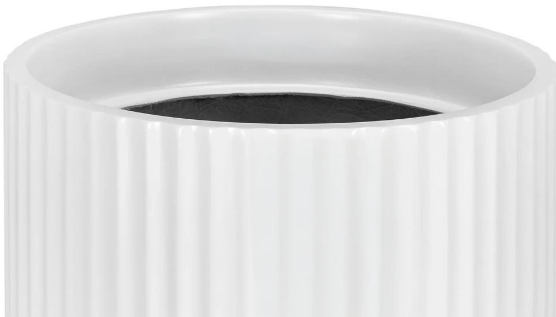
Ryflowana faktura powierzchni doniczki RC80 w kolorze biały mat

BARTPOL Sp. z o.o. ul. Strzeszyńska 33 60-479 Poznań NIP: 6932050703 t. 61 661 61 78 t. 607 531 181