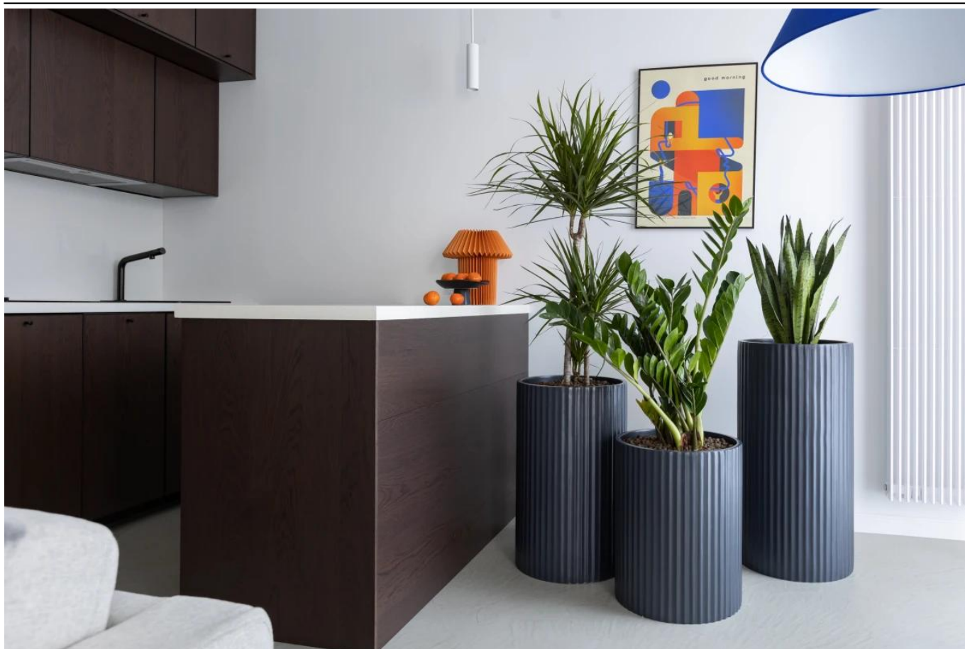
Ryflowana faktura powierzchni donic ZADORA Classic RC 50, 65 i 80 cm

BARTPOL Sp. z o.o. ul. Strzeszyńska 33 60-479 Poznań NIP: 6932050703 t. 61 661 61 78 t. 607 531 181