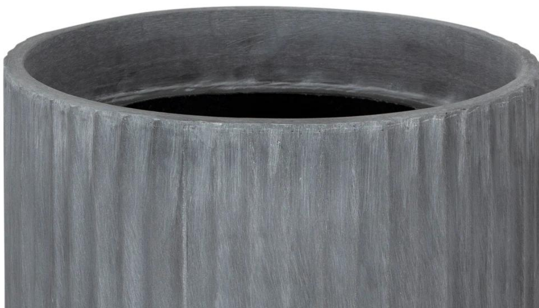
Ryflowana faktura powierzchni doniczki RC65 w kolorze szarego betonu

Donica RC65, w odcieniu szarego betonu , wyprodukowano z kompozytu laminatu włókna szklanego, żywicy poliestrowej i cementu. To wyjątkowe połączenie gwarantuje efekt betonu architektonicznego przy zachowaniu niewielkiej wagi . Materiały i technologia zaczerpnięte z przemysłu jachtowego zapewniają trwałość i odporność na warunki atmosferyczne przez długie lata.