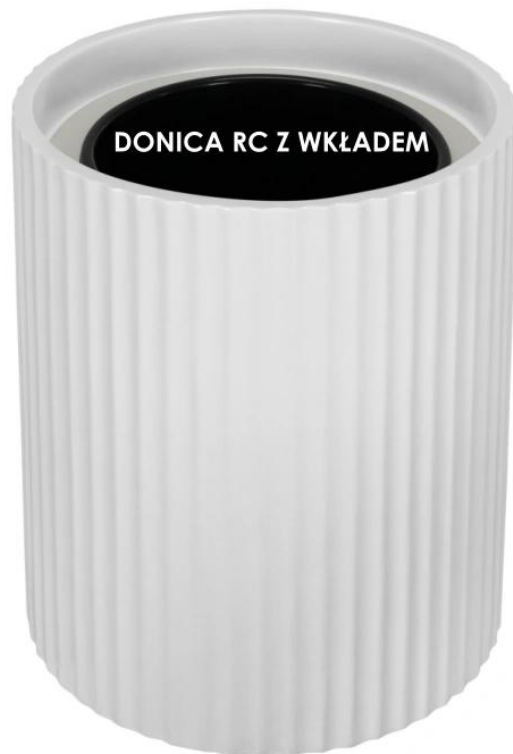
Donica RC bez wkładu | Donica RC z wkładem

Donice RC65 są oferowane w dwóch wariantach: z pełną objętością lub z wymowanym wewnętrznym wkładem . Wybór pomiędzy modelem z wkładem a bez niego daje nam szeroki zakres możliwości, które możemy dopasować do naszych własnych potrzeb i upodobań dekoracyjnych. To otwiera przed nami możliwość łatwego dostosowania donic do naszych preferencji, tworząc jednocześnie wyjątkową atmosferę pełną piękna roślin.