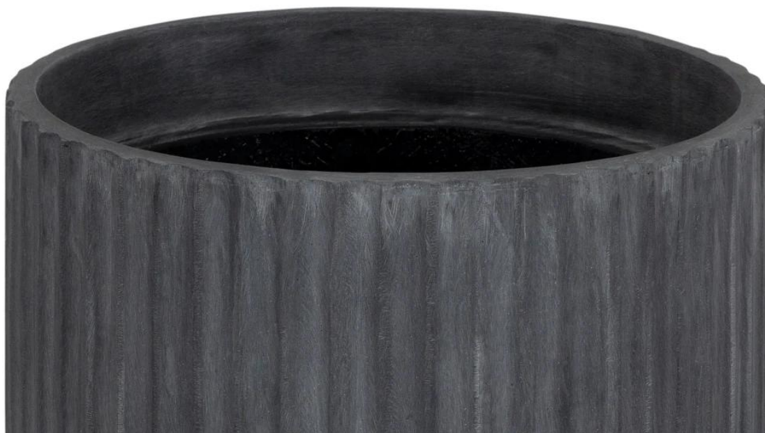
Ryflowana faktura powierzchni doniczki RC65 w kolorze grafitowego betonu

Donica RC65 została wykonana z laminatu włókna szklanego, żywicy poliestrowej i cementu. Surowa powierzchnia przypominająca beton architektoniczny jest w kolorze grafitowego betonu. To unikalne połączenie gwarantuje estetykę betonu architektonicznego przy jednoczesnym zachowaniu niewielkiej wagi. Dzięki zastosowaniu materiałów i technologii wykorzystywanych w przemyśle jachtowym, donica jest nie tylko trwała, ale także odporna na warunki atmosferyczne, co zapewnia jej długą żywotność.