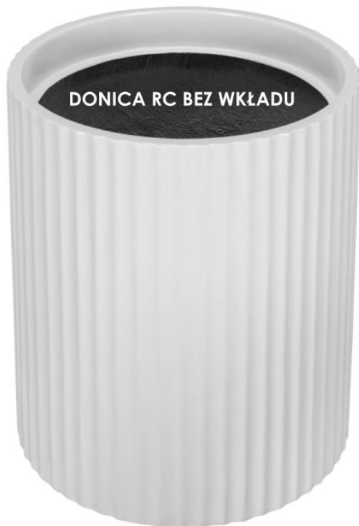
DONICA RC BEZ WKŁADU

BARTPOL Sp. z o.o. ul. Strzeszyńska 33 60-479 Poznań NIP: 6932050703 t. 61 661 61 78 t. 607 531 181