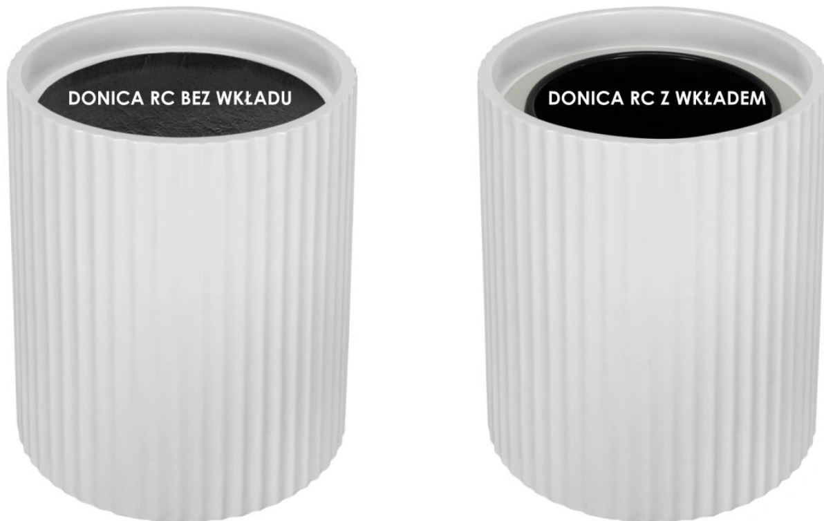
Donica RC bez wkładu | Donica RC z wkładem

Model donicy RC65 oferowany jest w dwóch różnych wariantach: bez wewnętrznego wkładu lub z wymowanym, wewnętrznym wkładem. Ta możliwość wyboru między donicą z wkładem a bez niego oferuje nam szerokie pole do dopasowania produktu do naszych indywidualnych potrzeb i dekoracyjnych gustów. Umożliwia nam łatwe dostosowanie donicy do naszych upodobań, jednocześnie tworząc wyjątkową atmosferę wypełnioną pięknymi roślinami.