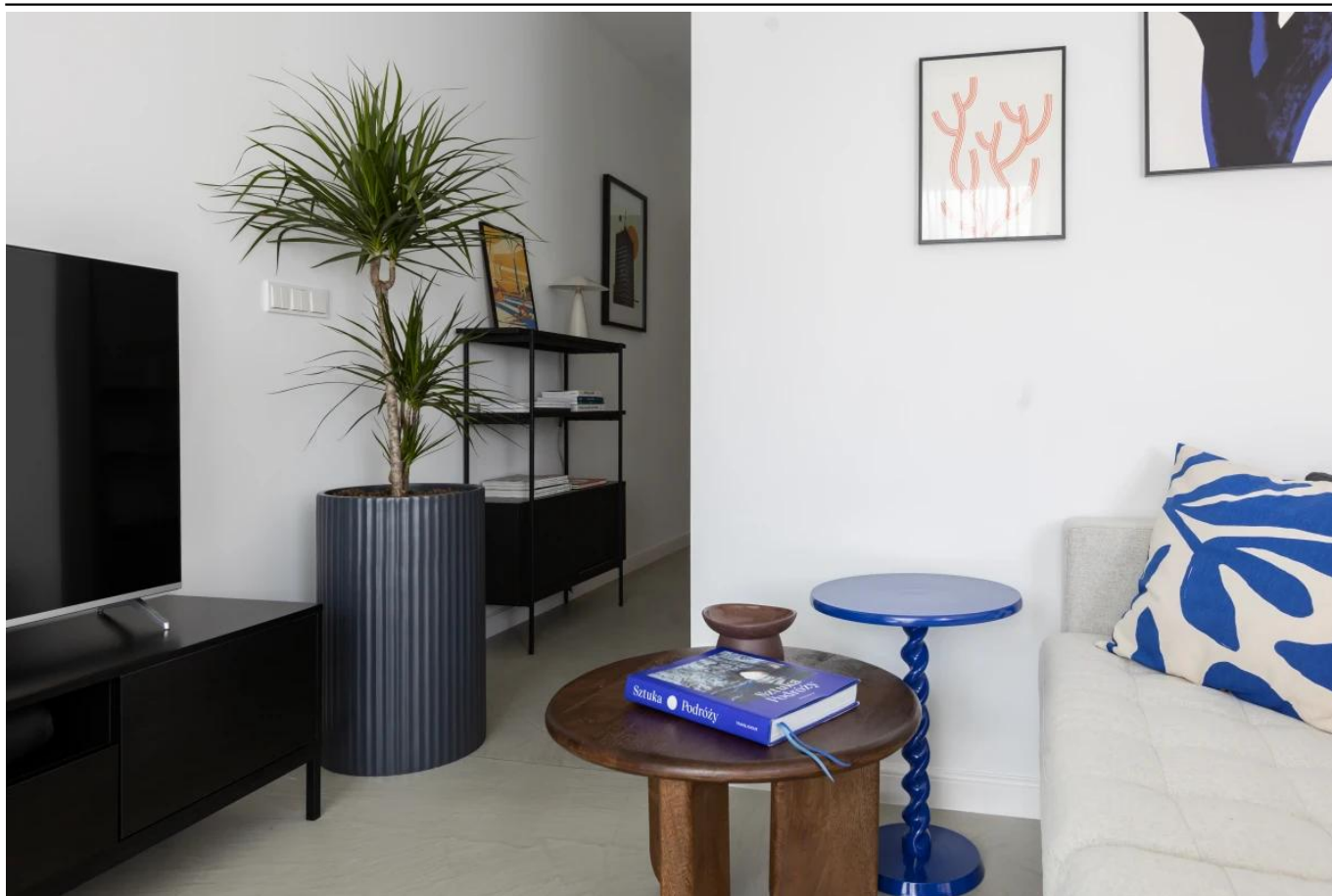
Dracena w antracytowej donicy ZADORA Classic RC65

BARTPOL Sp. z o.o. ul. Strzeszyńska 33 60-479 Poznań NIP: 6932050703 t. 61 661 61 78 t. 607 531 181