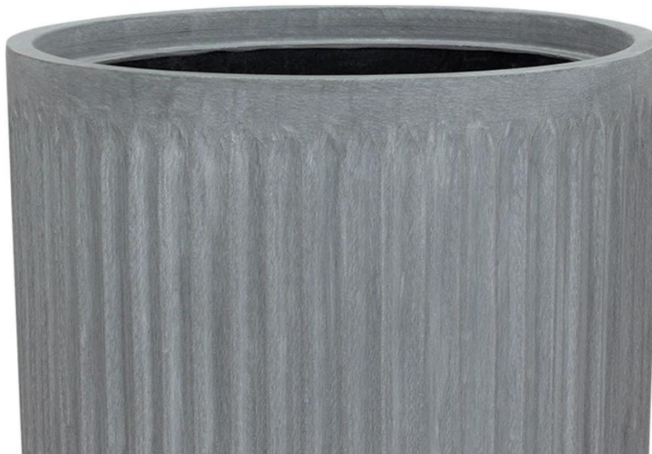
Ryflowana faktura powierzchni doniczki LEO37 w kolorze szarego betonu

Donica LEO37 wykonana jest z laminatu włókna szklanego i żywicy poliestrowej z dodatkiem cementu . To materiał kompozytowy, znany ze swojej wytrzymałości i trwałości, który powszechnie stosowany jest do produkcji kadłubów jachtów i żaglówek. Zastosowane materiały i technologia produkcji sprawiają, że donica LEO37 jest lekka, trwała i w 100% mrozooodporna.