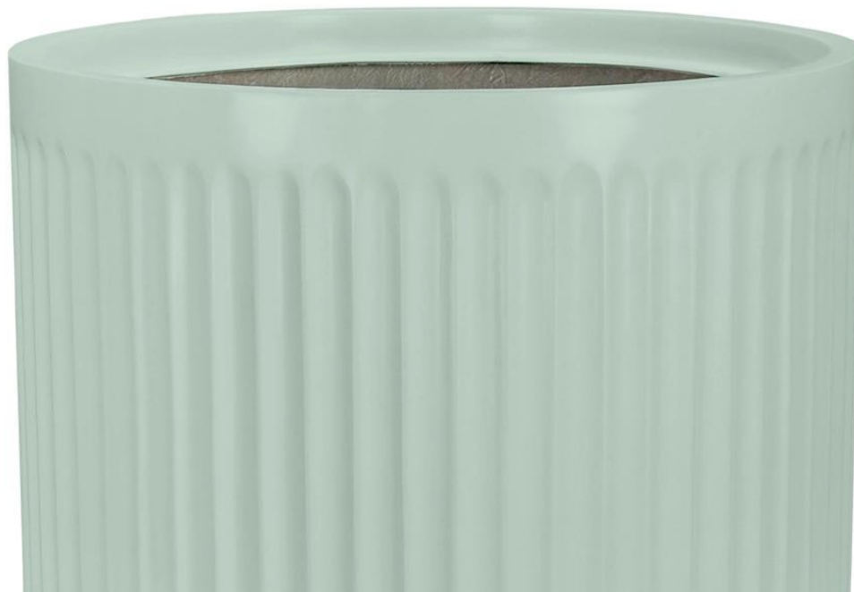
Ryflowana faktura powierzchni doniczki LEO37 w kolorze szalwiowy mat

Podobnie jak inne modele doniczek ZADORA Classic, donica LEO jest wykonana z laminatu z włókna szklanego i żywicy poliestrowej . Ten kompozytowy materiał, znany z lekkości i wytrzymałości, jest powszechnie wykorzystywany w produkcji kadłubów jachtów. Powierzchnia donicy jest pokryta wysokiej jakości farbą poliuretanową w kolorze szalwiowy mat o delikatnym satynowym wykończeniu . Dzięki zastosowanym materiałom donica jest odporna na zmienne warunki atmosferyczne, wyjątkowo trwała i lekka.