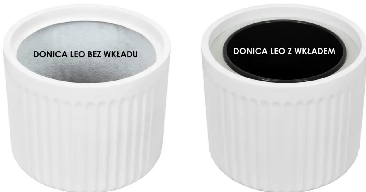
Donica LEO bez wkładu | Donica LEO z wkładem

Donica LEO33 posiada atrakcyjną możliwość zastosowania wewnętrznego, wymowanego wkładu o pojemności 10 litrów, które wzbogaca jej funkcjonalność, umożliwiając łatwiejszą pielęgnację roślin. Ta innowacyjna opcja pozwala na wygodną i elastyczną wymianę roślin, umożliwiając swobodne modyfikowanie aranżacji wewnątrz zgodnie z naszymi preferencjami.