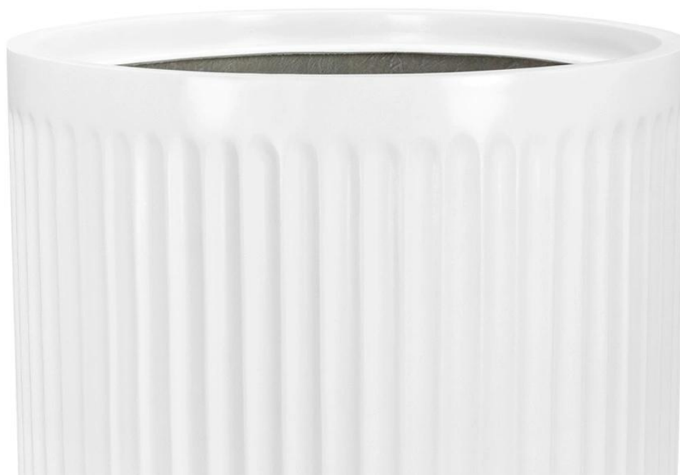
Ryflowana faktura powierzchni doniczki LEO33 w kolorze biały mat

Doniczki LEO33 wyróżniają się nie tylko estetyką, lecz także podkreślają piękno roślin. Biały matowy kolor o gładkiej powierzchni ułatwia utrzymanie czystości. Te doniczki nie tylko przyciągają profesjonalnych projektantów, lecz także osoby poszukujące oryginalnych akcentów do swoich wnętrz i ogrodów. Bez względu na miejsce zastosowania, wnętrza czy zewnątrz, doniczki LEO dodają wyjątkowego uroku, wprowadzając harmonię i styl, oraz ożywiając przestrzeń elegancją.