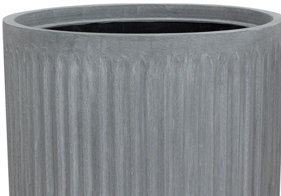
Ryflowana faktura powierzchni doniczki LEO29 w kolorze szarego betonu

Doniczki LEO charakteryzuje żłobiona powierzchnia, która przypomina rzymskie kolumny. Połączenie koloru szarego betonu i tej unikalnej ryflowanej faktury powierzchni doskonale pasuje do nowoczesnych aranżacji o industrialnym charakterze.