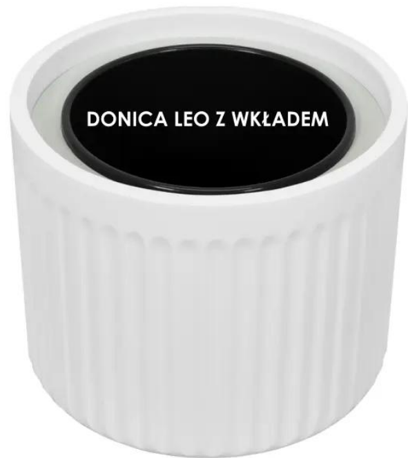
Donica LEO bez wkładu | Donica LEO z wkładem

Doniczki LEO oferujemy w czterech rozmiarach i sześciu kolorach, dzięki czemu możesz Tworzyć piętrowe roślinne kompozycje na tarasie lub w domu czy biurze.