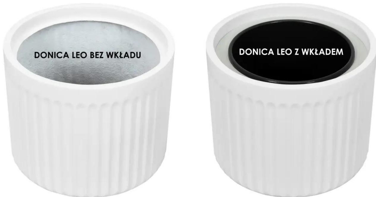
Donica LEO bez wkładu | Donica LEO z wkładem

Doniczki LEO29 oferowane są w dwóch opcjach: bez wewnętrznego wkładu oraz z wewnętrznym wkładem , który zawiera estetyczny pierścień-ramkę do zawieszenia wyjmowanego pojemnika o pojemności 10 litrów.