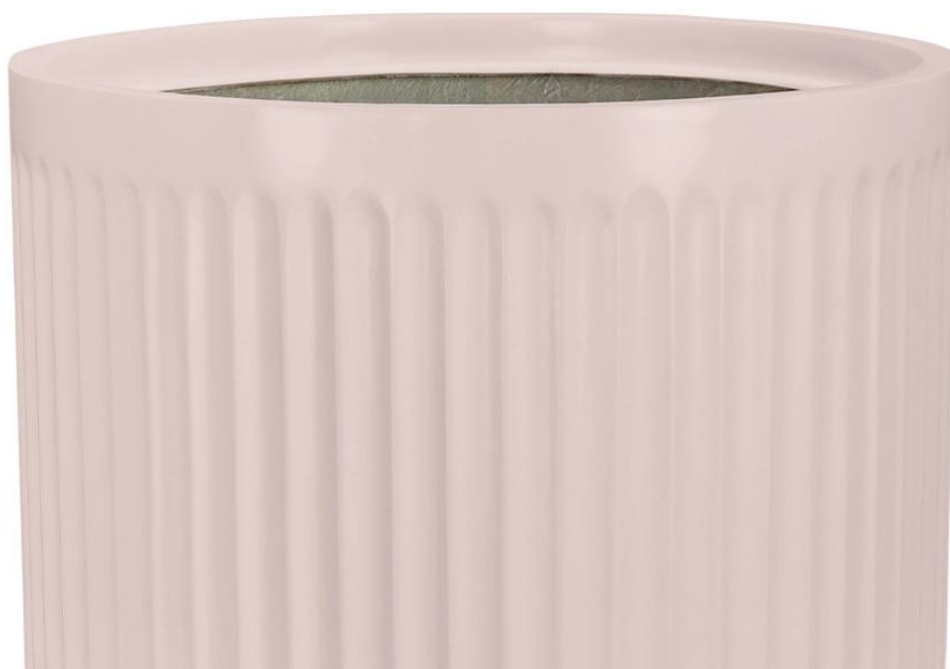
Ryflowana faktura powierzchni doniczki LEO29 w kolorze różowy mat

Pionowe żłobienia na bokach doniczki LEO przywodzą na myśl majestatyczne rzymskie kolumny, nadając jej wyjątkowego uroku. Okrągła doniczka LEO29 w matowym różowym kolorze oraz charakterystycznej ryflowanej powierzchni to wyjątkowym dodatkiem do nowoczesnego wnętrza lub zewnętrznej strefy relaksu. Ta urocza różowa doniczka z pewnością wniesie ożywczą energię do Twojego otoczenia.