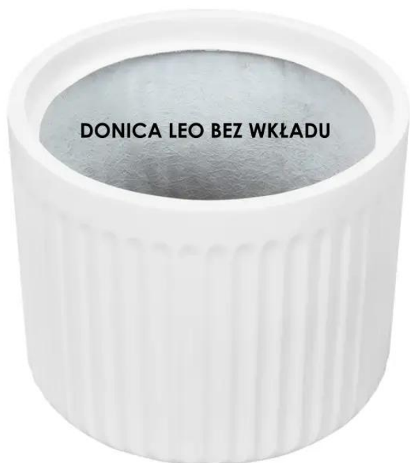
DONICA LEO BEZ WKŁADU

BARTPOL Sp. z o.o. ul. Strzeszyńska 33 60-479 Poznań NIP: 6932050703 t. 61 661 61 78 t. 607 531 181