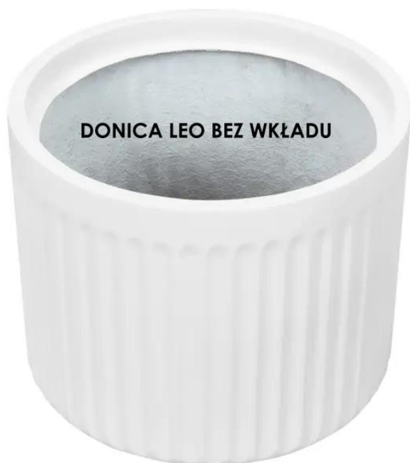
DONICA LEO BEZ WKŁADU

BARTPOL Sp. z o.o. ul. Strzeszyńska 33 60-479 Poznań NIP: 6932050703 t. 61 661 61 78 t. 607 531 181