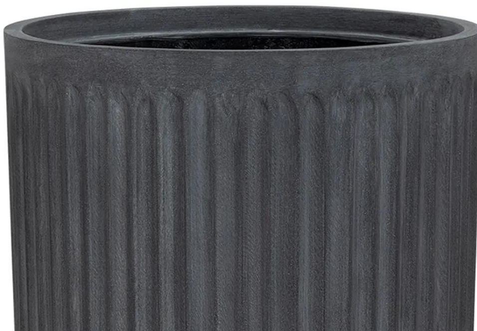
Ryflowana faktura powierzchni doniczki LEO29 w kolorze grafitowego betonu

Doniczki LEO charakteryzuje ryflowana powierzchnia, która przypomina rzymskie kolumny. Połączenie ciemnego grafitowego koloru przypominającego beton architektoniczny i tej unikalnej żłobionej faktury powierzchni doskonale pasuje do nowoczesnych aranżacji o industrialnym charakterze.