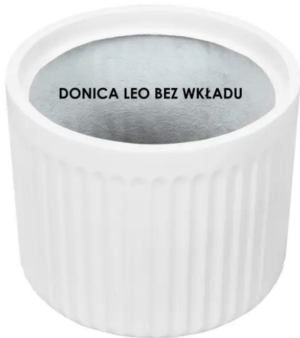
DONICA LEO BEZ WKŁADU

BARTPOL Sp. z o.o. ul. Strzeszyńska 33 60-479 Poznań NIP: 6932050703 t. 61 661 61 78 t. 607 531 181