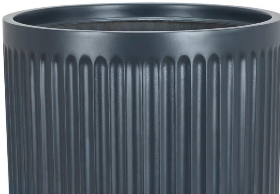
Ryflowana faktura powierzchni doniczki LEO29 w kolorze antracyt mat

Pionowe żłobienia na bokach doniczki LEO przywodzą na myśl rzymskie kolumny. Okrągła doniczka LEO29 w matowym antracytowym kolorze i o charakterystycznej ryflowanej powierzchni doskonale wpisuje się w aktualne trendy wyposażenia wnętrz i urządzenia przestrzeni relaksu.