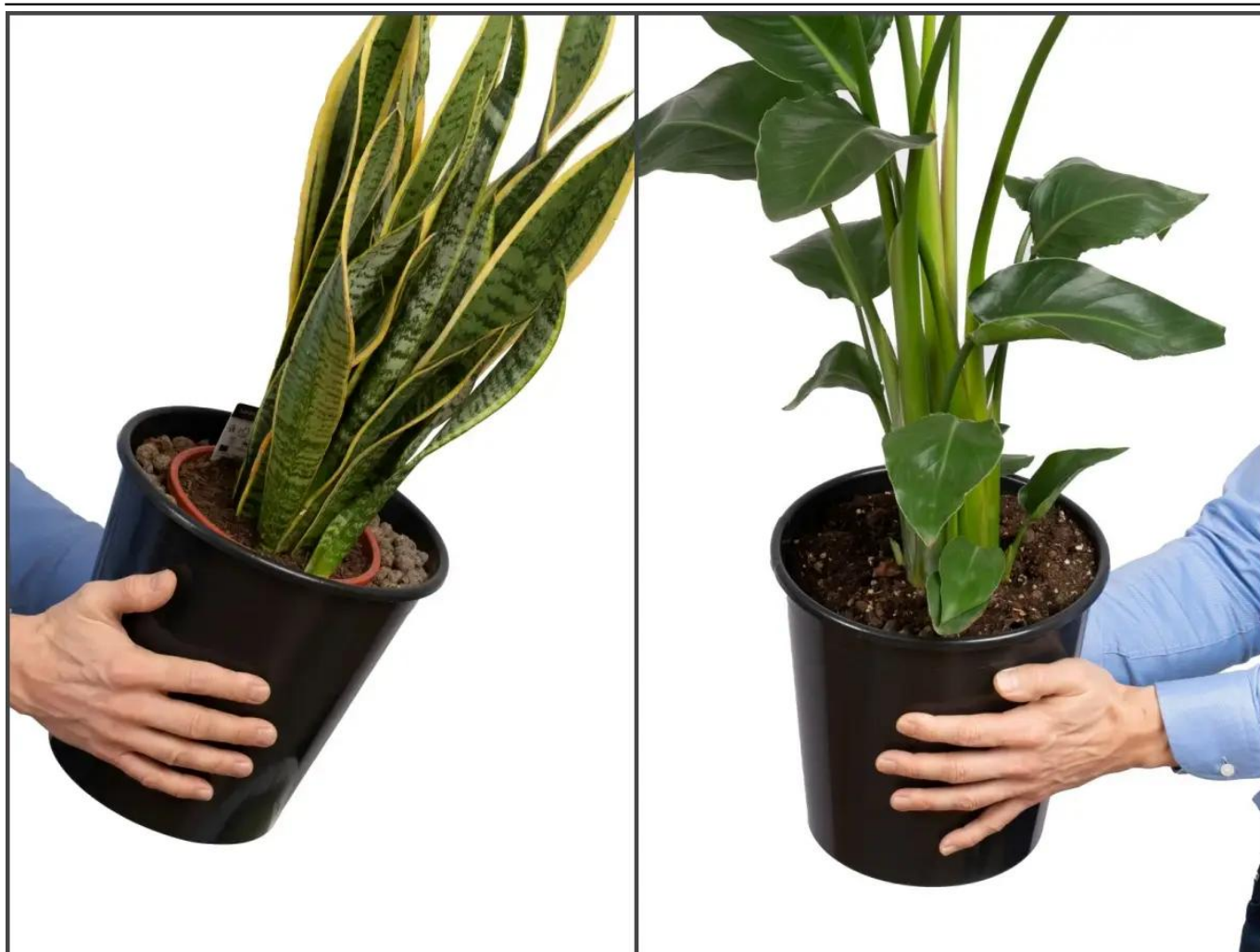
Dwa sposoby wykorzystania wyjmowanego wkładu w donicy D982H

Drugim sposobem jest wykorzystanie wkładu jak doniczki docelowej i przesadzenie do niej zakupionej rośliny. Takie rozwiązanie zapewnia lepsze warunki dla rozwoju rośliny. W zależności od potrzeb możemy wówczas we wkładzie wywiercić otwory odpływowe lub nie. Przy wywierconych otworach nadmiar wody będzie spływał na dno donicy. Jest ona szczelna i woda nie będzie wypływać na podłogę.