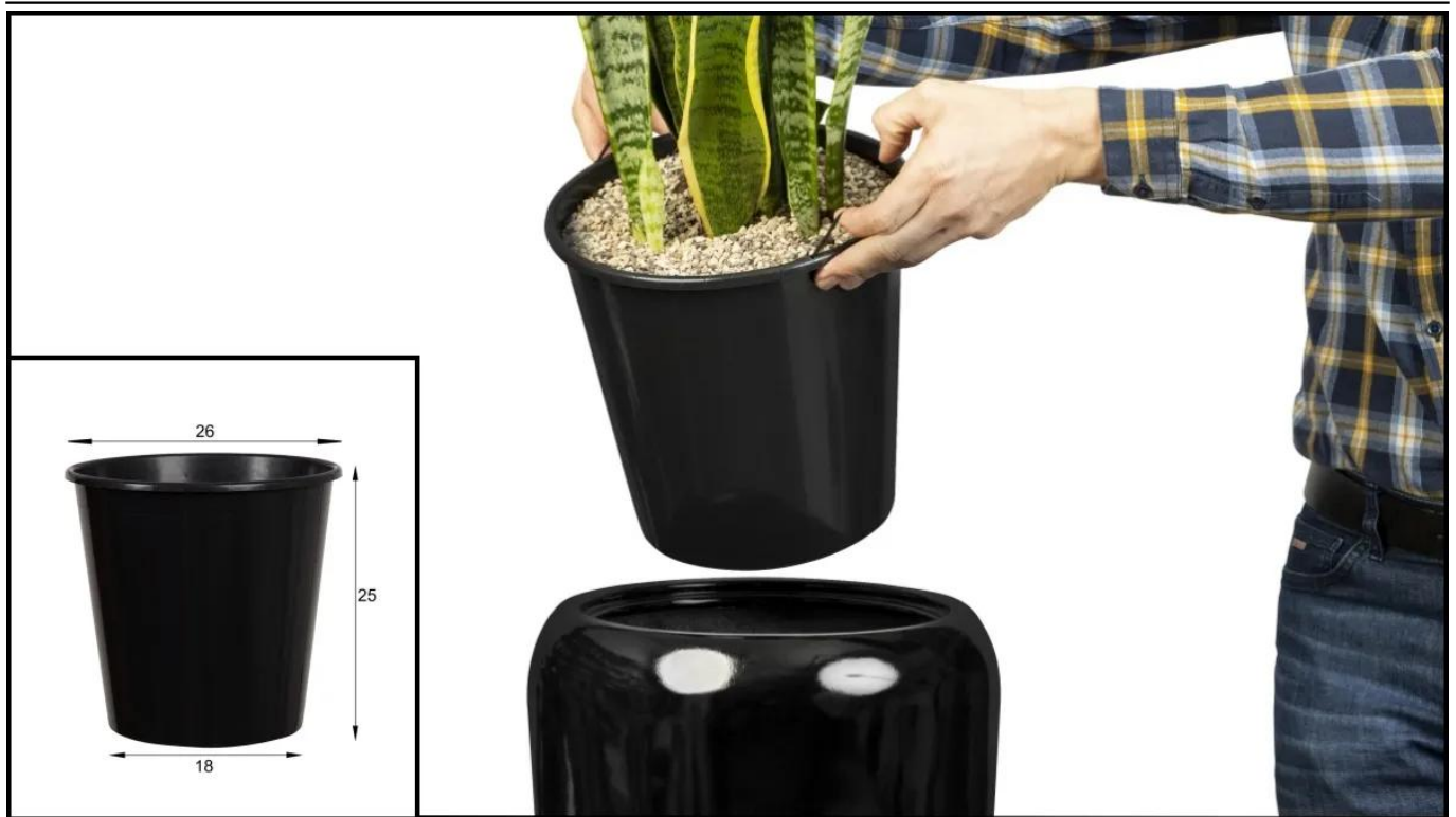
Wymowany wkład donicy D982B.

BARTPOL Sp. z o.o. ul. Strzeszyńska 33 60-479 Poznań NIP: 6932050703 t. 61 661 61 78 t. 607 531 181