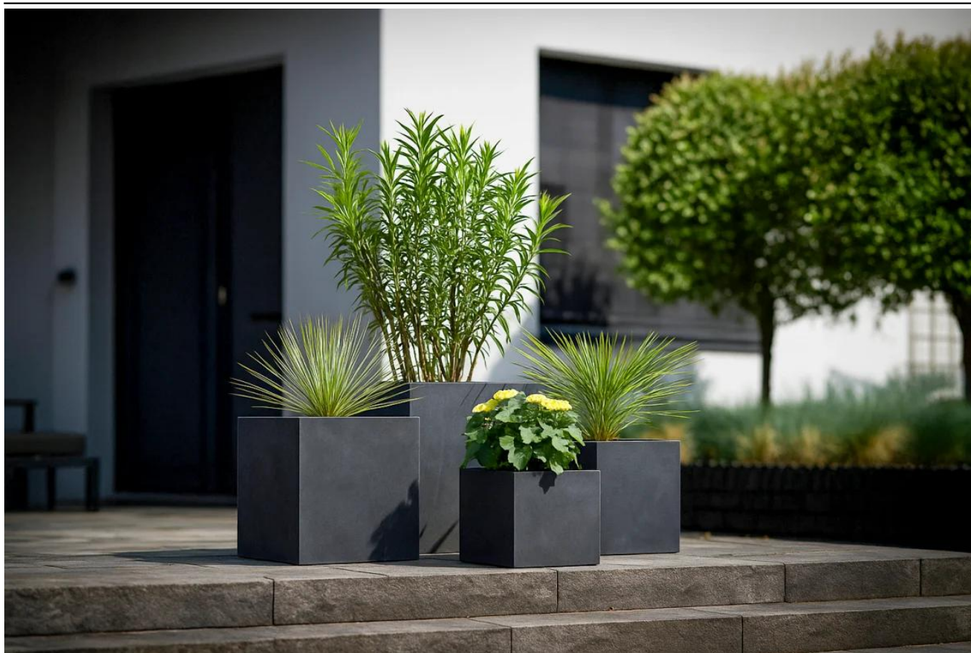
Komplet donic tarsowych D92A, B, C i D w kolorze grafitowy beton

BARTPOL Sp. z o.o. ul. Strzeszyńska 33 60-479 Poznań NIP: 6932050703 t. 61 661 61 78 t. 607 531 181