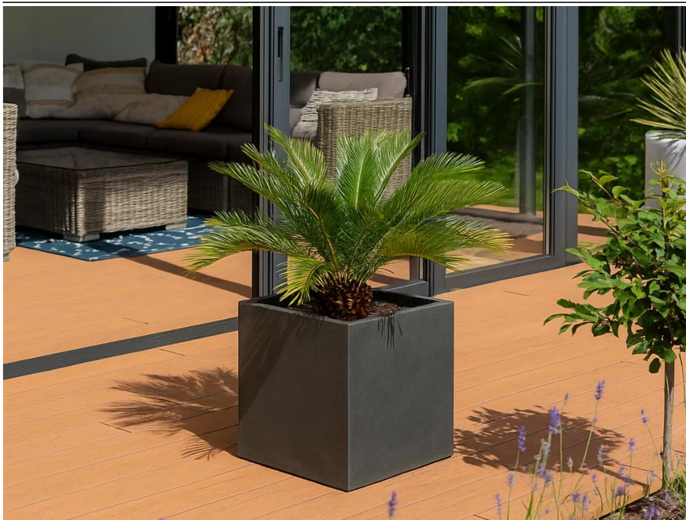
Palma (cykas) w donicy D92C grafitowy beton

BARTPOL Sp. z o.o. ul. Strzeszyńska 33 60-479 Poznań NIP: 6932050703 t. 61 661 61 78 t. 607 531 181