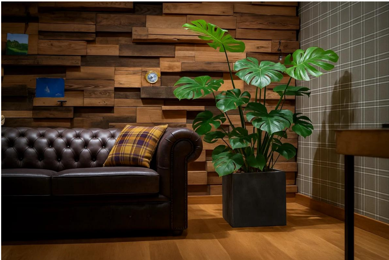
Monstera w donicy D92B grafitowy beton w salonie

Na zdjęciu aranżacyjnym donica została zestawiona z dużą monstera i ustawiona we wnętrzu w stylu nowoczesnego loftu. Ciemny grafitowy kolor powierzchni współgra z głębokim odcieniem skórzanej sofy, drewnianą podłogą i industrialną ścianą z paneli, tworząc spójną, elegancką przestrzeń. Roślina o wyrazistym pokroju efektownie kontrastuje z geometryczną bryłą donicy, stanowiąc silny element wizualny wystroju salonu.