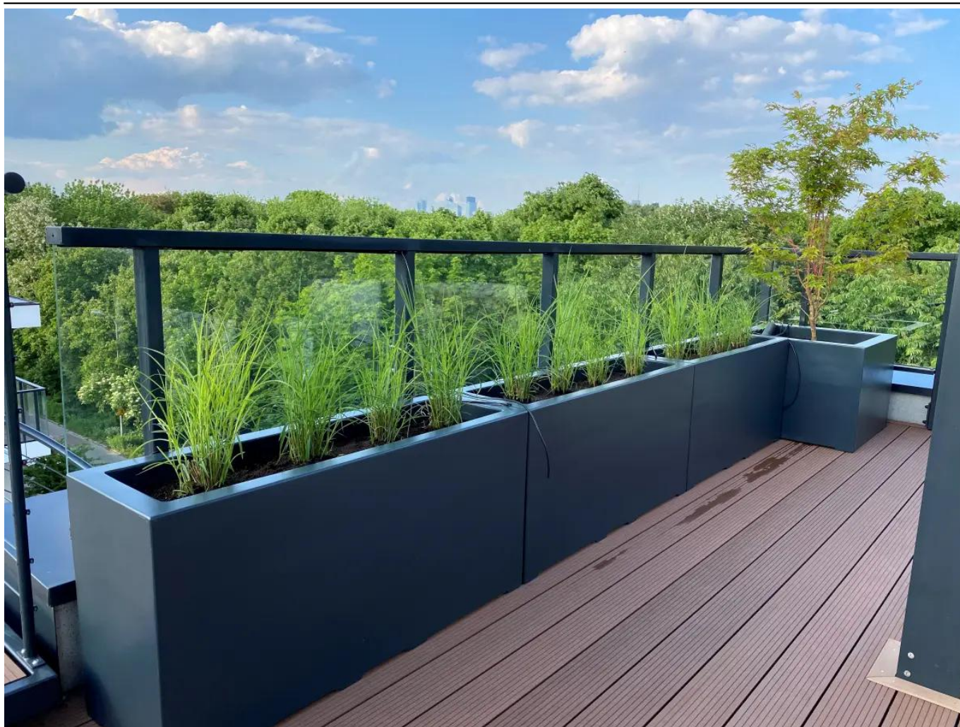
Donice tarasowe D913G 150x50x60 cm antracyt mat na taras

BARTPOL Sp. z o.o. ul. Strzeszyńska 33 60-479 Poznań NIP: 6932050703 t. 61 661 61 78 t. 607 531 181