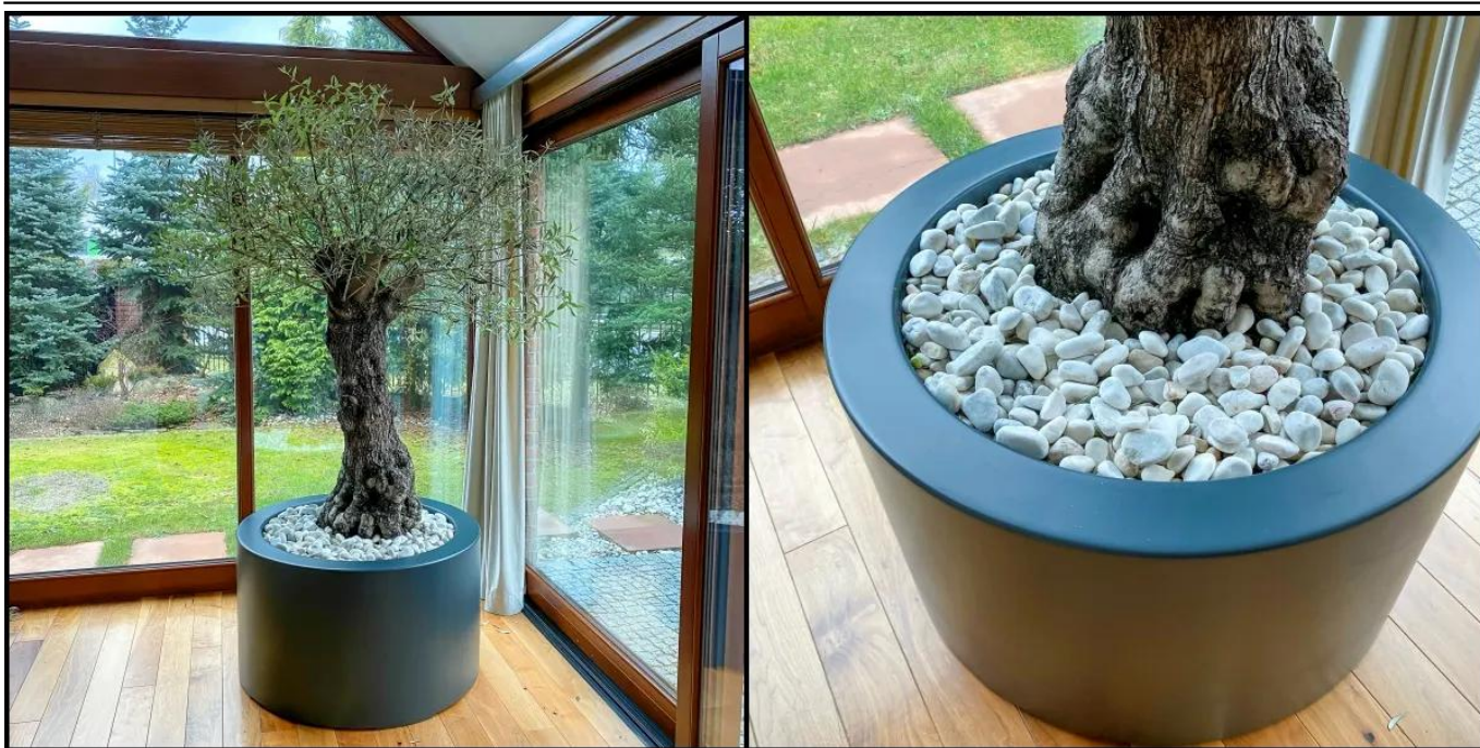
Drzewko oliwne w antracytowej donicy ZADORA Premium D901ED

BARTPOL Sp. z o.o. ul. Strzeszyńska 33 60-479 Poznań NIP: 6932050703 t. 61 661 61 78 t. 607 531 181