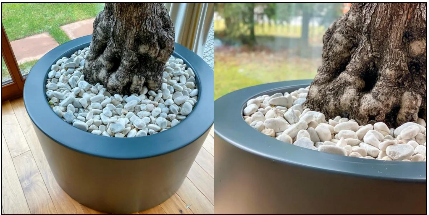
Drzewko oliwne w antracytowej donicy ZADORA Premium D901ED Ø80x60 cm

BARTPOL Sp. z o.o. ul. Strzeszyńska 33 60-479 Poznań NIP: 6932050703 t. 61 661 61 78 t. 607 531 181