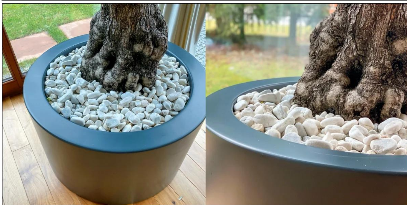
Drzewko oliwne w antracytowej donicy ZADORA Premium D901ED Ø80x60 cm

BARTPOL Sp. z o.o. ul. Strzeszyńska 33 60-479 Poznań NIP: 6932050703 t. 61 661 61 78 t. 607 531 181