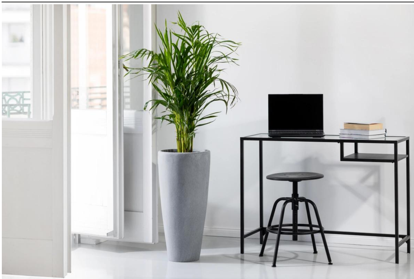
Donica D282C Ø32x66 cm szary beton

BARTPOL Sp. z o.o. ul. Strzeszyńska 33 60-479 Poznań NIP: 6932050703 t. 61 661 61 78 t. 607 531 181