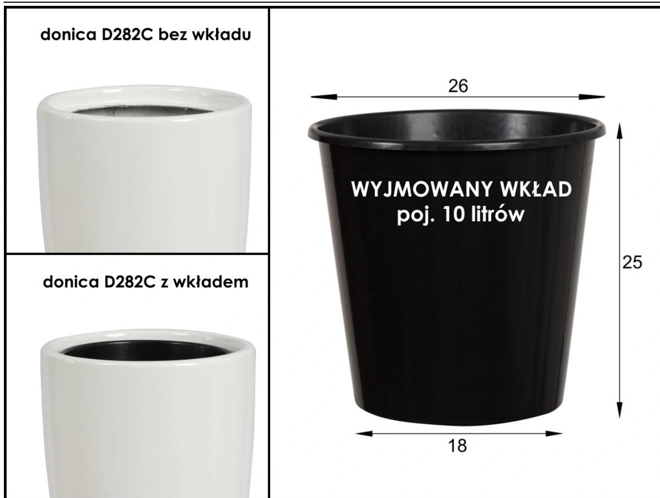
Donica ZADORA Classic D282C/BPD bez wkładu i z wewnętrznym wkładem