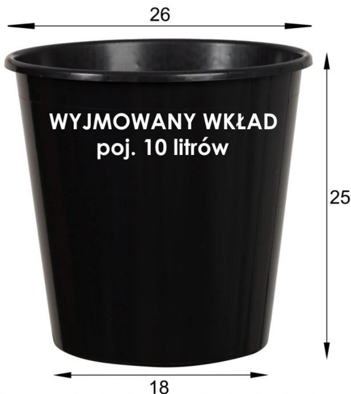
Donica ZADORA Classic D282C/BPD bez wkładu i z wewnętrznym wkładem