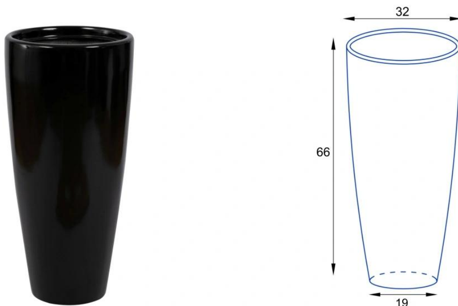
Donica D282C/BPD - wymiary wersji bez wkładu

Model D282C/BPD, pozbawiony jest wewnętrznej półki i oferuje aż 45 litrów pojemności, co czyni go idealnym do uprawy palm i innych roślin zewnętrznych. Przy użytkowaniu na zewnątrz zaleca się wykonanie otworów odpływowych w dnie donicy.