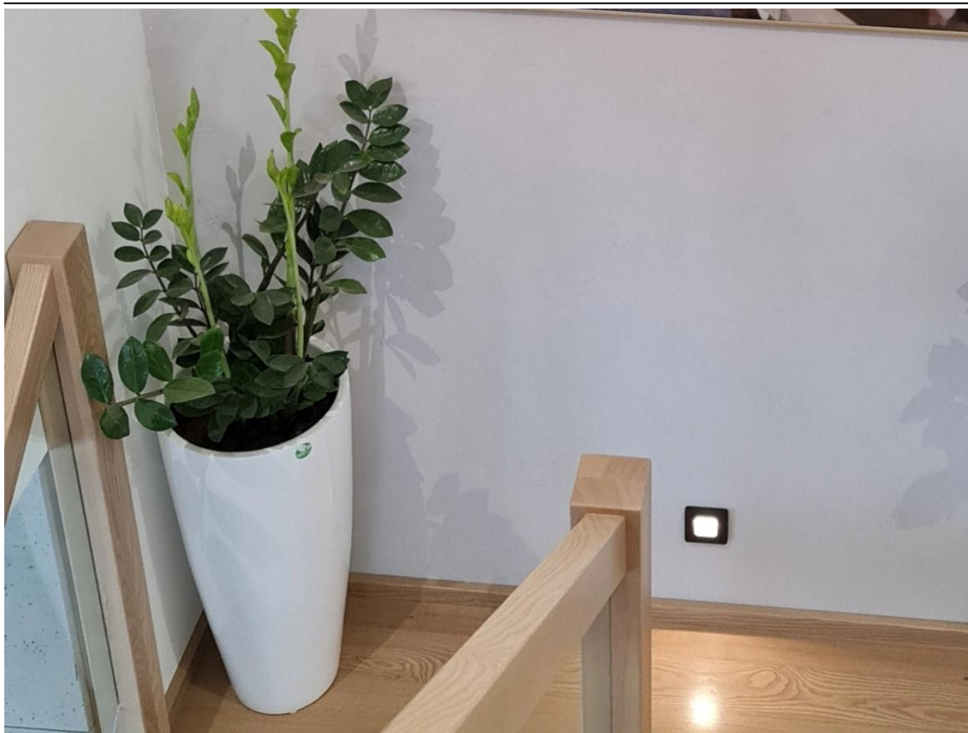
Zamiokulkas zamiolistny w białej donicy Zadora Classic D282C

BARTPOL Sp. z o.o. ul. Strzeszyńska 33 60-479 Poznań NIP: 6932050703 t. 61 661 61 78 t. 607 531 181