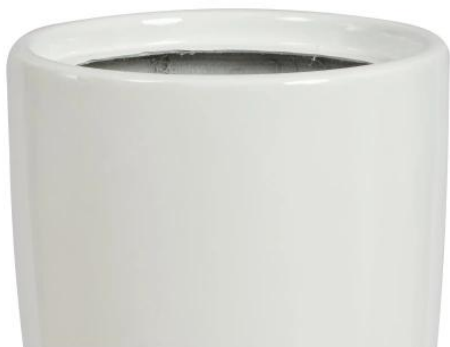
donica D282C z wkładem