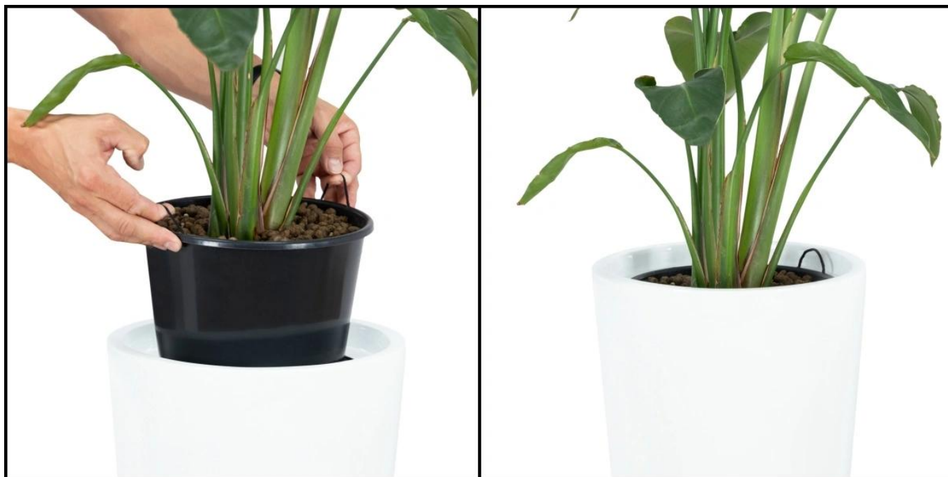
Stosowanie wyjmowanego wkładu zalecane jest do mniejszych roślin ozdobnych

Korzystanie z praktycznego wkładu wewnętrznego znacząco ułatwia pielęgnację roślin i zapewnia wygodę. Donica D208C z wyjmowanym wkładem to doskonałe rozwiązanie zarówno do domu, jak i biura, umożliwiające łatwe przenoszenie i wymianę roślin, co otwiera nowe możliwości aranżacyjne.