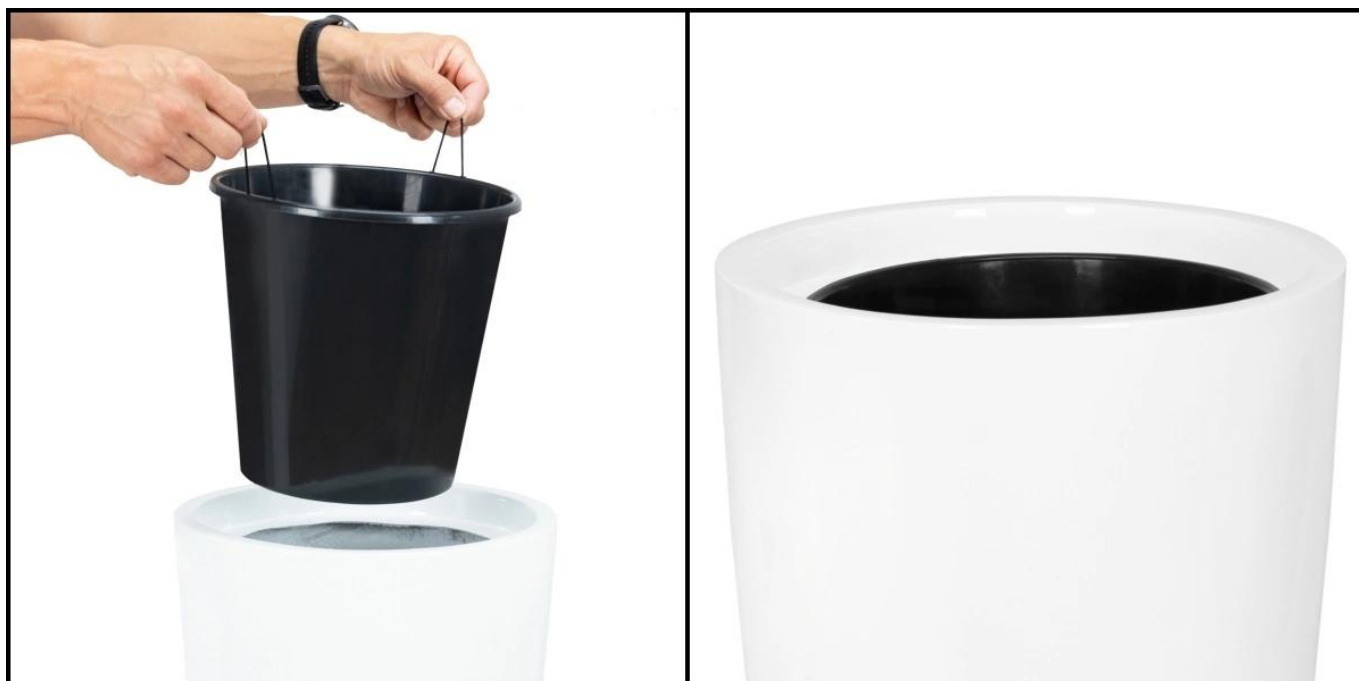
Wymowany wewnętrzny wkład idealnie pasuje do donicy

Donica D208C została zaprojektowana tak, aby umożliwić stabilne zawieszenie wymowanego wkładu na dedykowanej ramce. Takie rozwiązanie eliminuje konieczność stosowania wypełniaczy, a przy tym pozwala na szybkie wyjęcie donicy wewnętrznej, gdy zachodzi potrzeba wymiany rośliny lub czyszczenia wnętrza. Wkład o średnicy 26 cm i głębokości 25 cm mieści 10 litrów podłoża - to idealna pojemność dla większości roślin ozdobnych hodowanych w pomieszczeniach. Jego powierzchnię można łatwo udekorować keramzytem, kamykami lub korą, co podnosi walory estetyczne całej aranżacji.