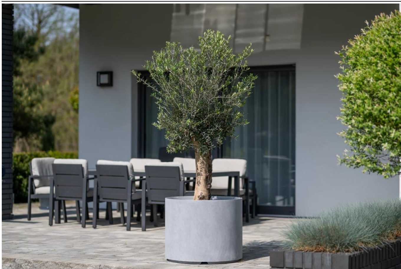
Oliwka europejska w donicy D101ED szary beton na tarasie

BARTPOL Sp. z o.o. ul. Strzeszyńska 33 60-479 Poznań NIP: 6932050703 t. 61 661 61 78 t. 607 531 181