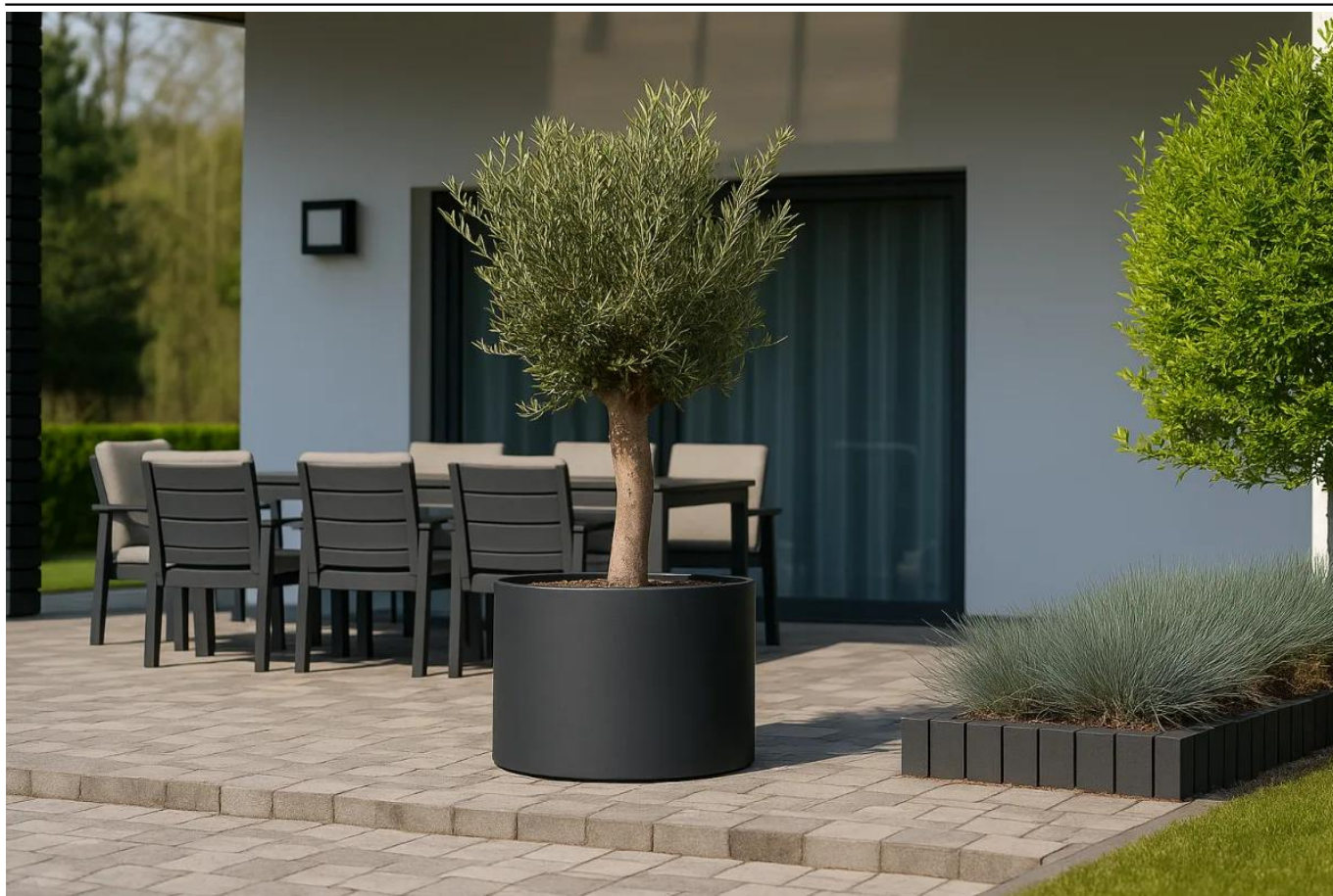
Oliwka europejska w donicy D101ED antracyt mat na tarasie

BARTPOL Sp. z o.o. ul. Strzeszyńska 33 60-479 Poznań NIP: 6932050703 t. 61 661 61 78 t. 607 531 181