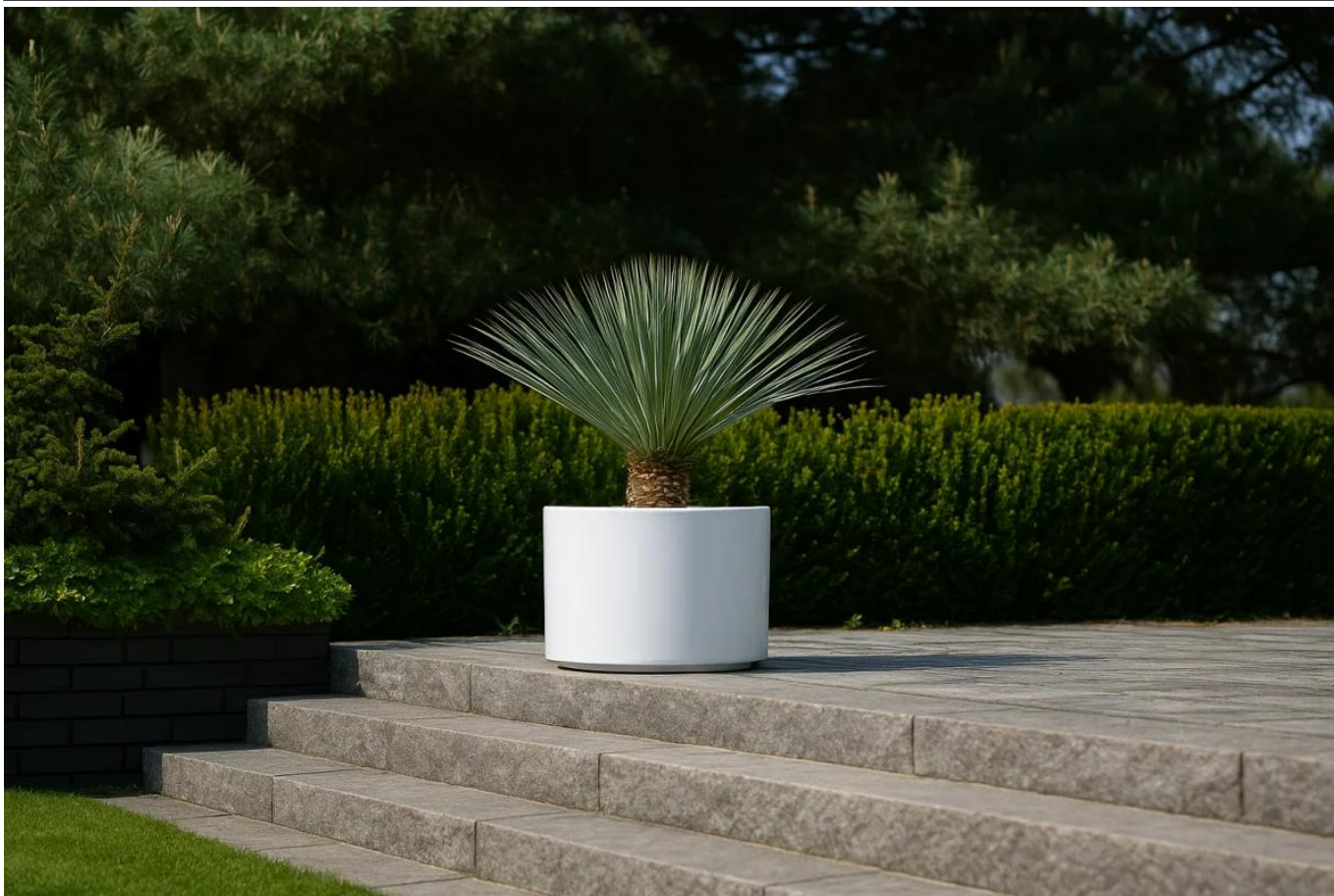
Juka rostrata w donicy D101DC biały połysk na tarasie

BARTPOL Sp. z o.o. ul. Strzeszyńska 33 60-479 Poznań NIP: 6932050703 t. 61 661 61 78 t. 607 531 181