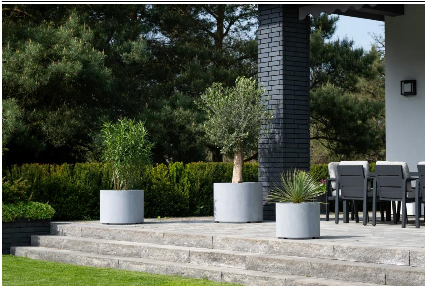
Donice D101CA, D101CD i D101ED w kolorze szary beton

BARTPOL Sp. z o.o. ul. Strzeszyńska 33 60-479 Poznań NIP: 6932050703 t. 61 661 61 78 t. 607 531 181