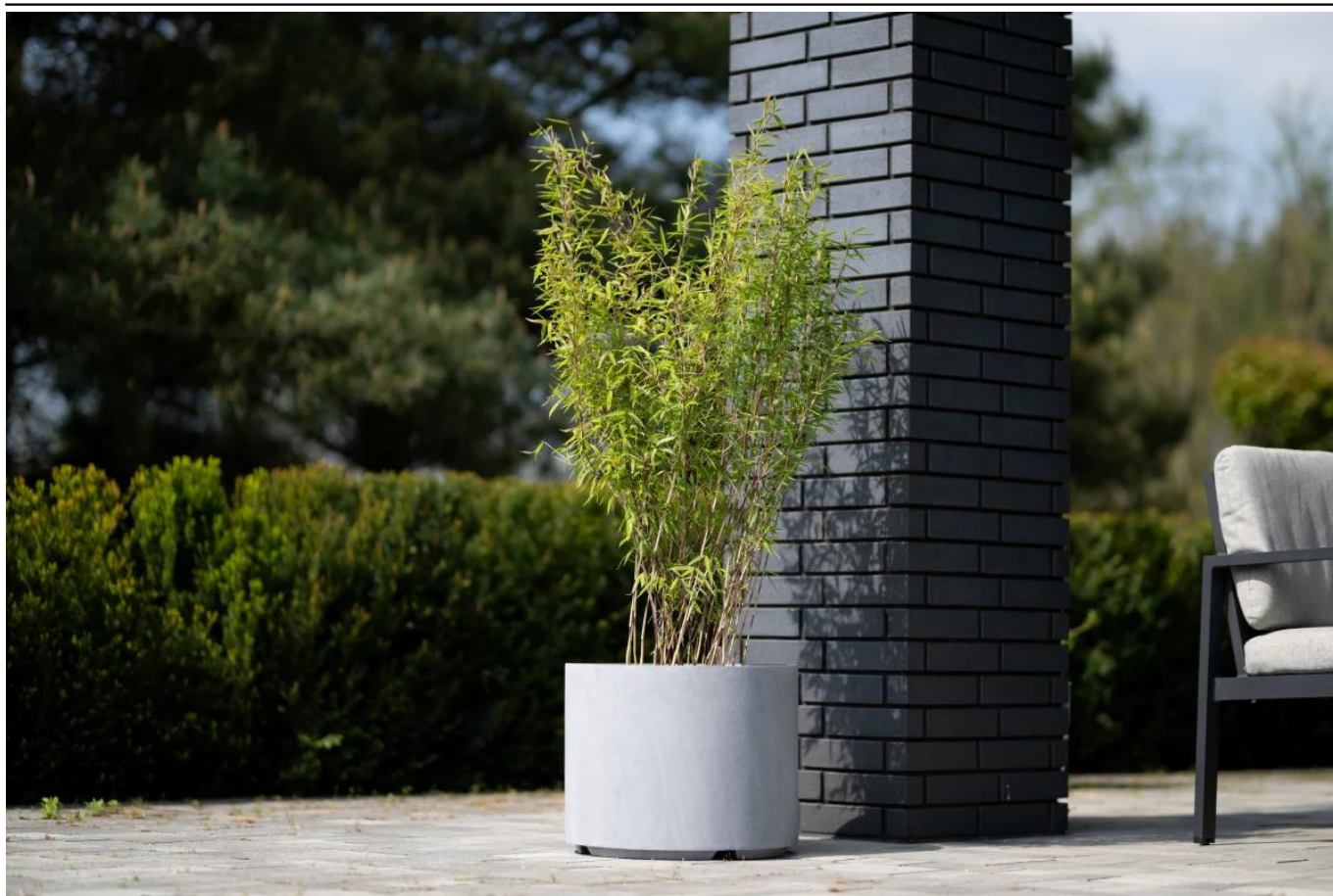
Bambus Nitida fargesia volcano w donicy D101CA szary beton na tarasie

BARTPOL Sp. z o.o. ul. Strzeszyńska 33 60-479 Poznań NIP: 6932050703 t. 61 661 61 78 t. 607 531 181