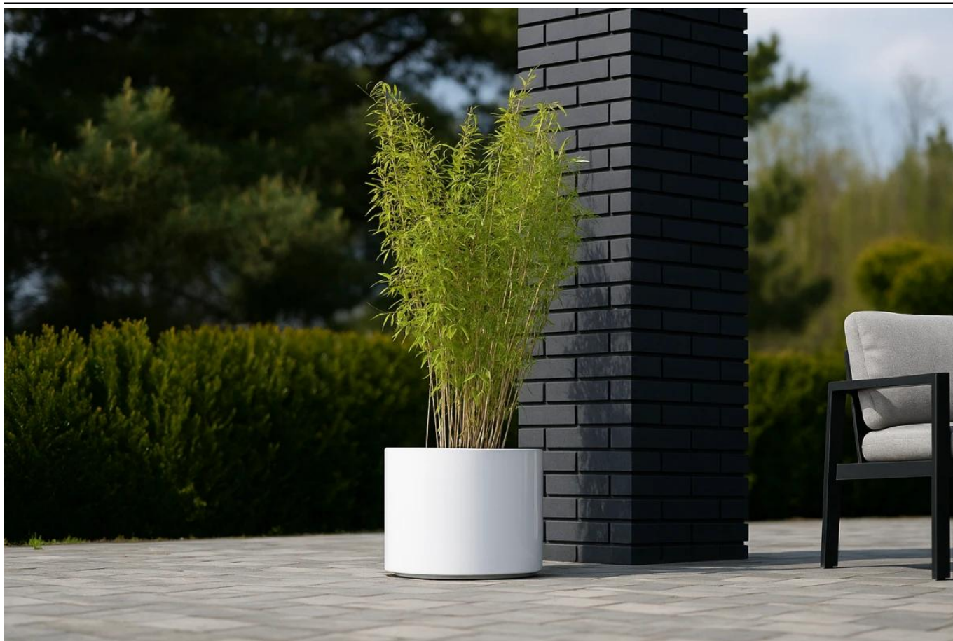
Bambus Nitida fargesia volcano w donicy D101CA biały połysk na tarasie

BARTPOL Sp. z o.o. ul. Strzeszyńska 33 60-479 Poznań NIP: 6932050703 t. 61 661 61 78 t. 607 531 181