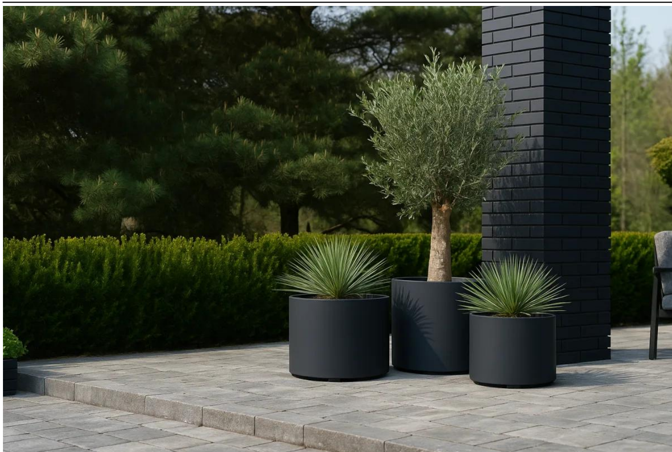
Donice D101CA, D101CD i D101ED w kolorze antracyt mat

BARTPOL Sp. z o.o. ul. Strzeszyńska 33 60-479 Poznań NIP: 6932050703 t. 61 661 61 78 t. 607 531 181