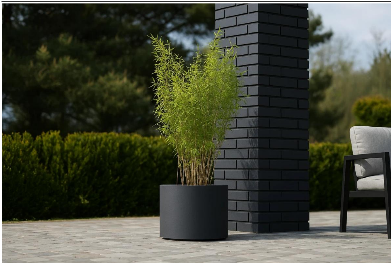
Bambus Nitida fargesia volcano w donicy D101CA antracyt mat na tarasie

BARTPOL Sp. z o.o. ul. Strzeszyńska 33 60-479 Poznań NIP: 6932050703 t. 61 661 61 78 t. 607 531 181