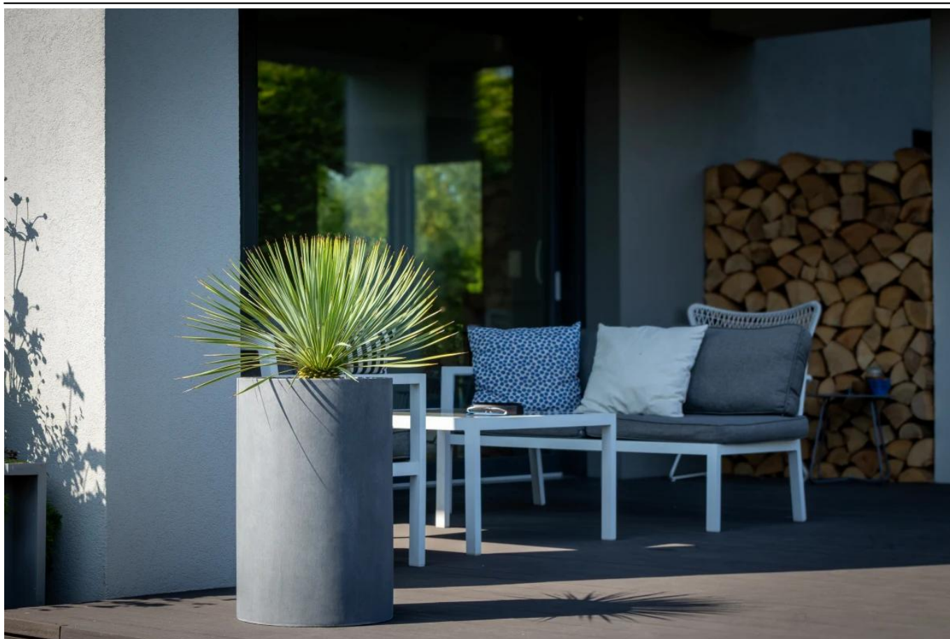
Donica tarasowa D101C Ø40x60 cm grafitowy beton

BARTPOL Sp. z o.o. ul. Strzeszyńska 33 60-479 Poznań NIP: 6932050703 t. 61 661 61 78 t. 607 531 181