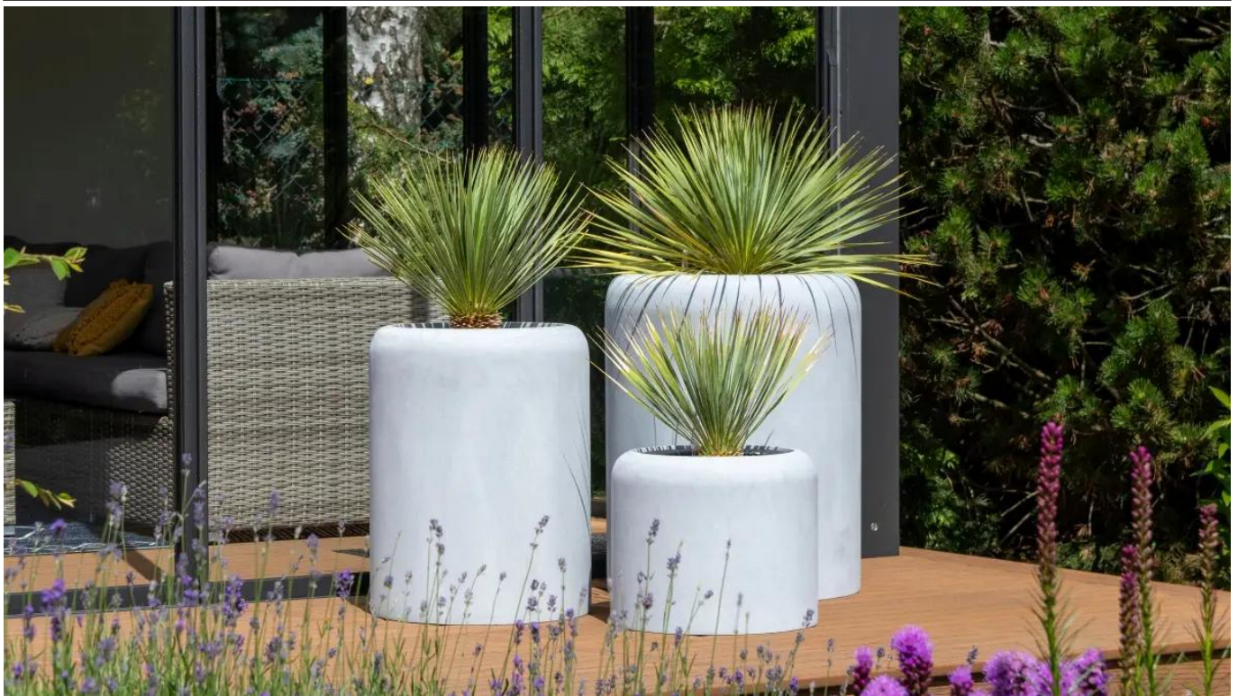
Donice AMBIENTE 35, 60 i 70 w kolorze szary beton

BARTPOL Sp. z o.o. ul. Strzeszyńska 33 60-479 Poznań NIP: 6932050703 t. 61 661 61 78 t. 607 531 181