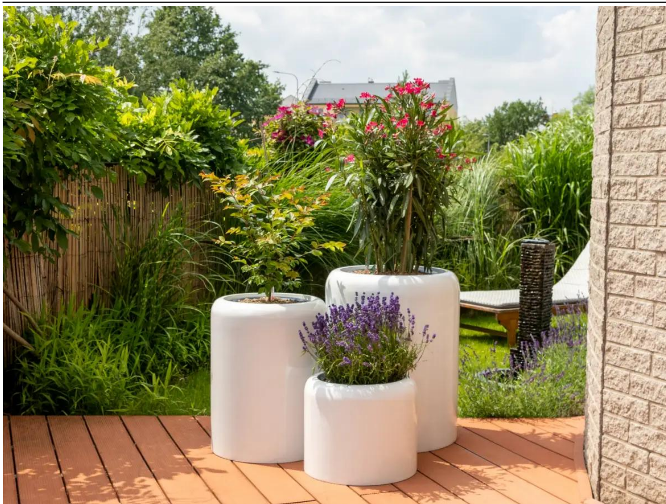
Donice AMBIENTE 35, 60 i 70 w kolorze biały połysk

BARTPOL Sp. z o.o. ul. Strzeszyńska 33 60-479 Poznań NIP: 6932050703 t. 61 661 61 78 t. 607 531 181