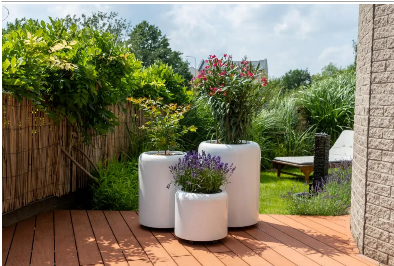
Podstawa z kółkami - opcja dodatkowa

BARTPOL Sp. z o.o. ul. Strzeszyńska 33 60-479 Poznań NIP: 6932050703 t. 61 661 61 78 t. 607 531 181