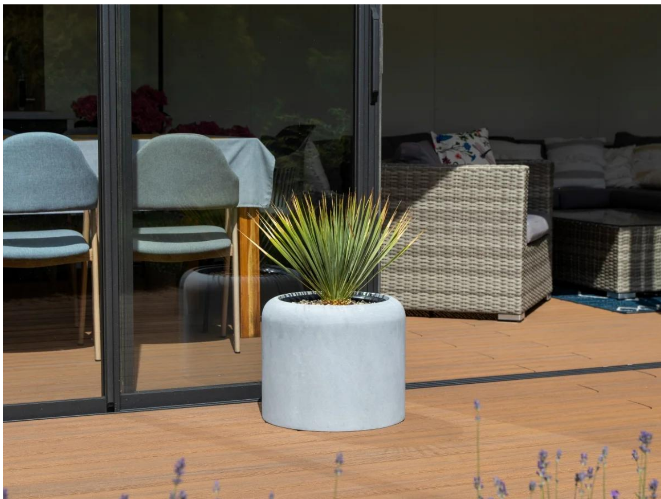
Juka rostrata na tarasie w donicy ZADORA Classic AMBIENTE 35 biały beton

tworzyć wyjątkową atmosferę pełną roślinnego uroku.