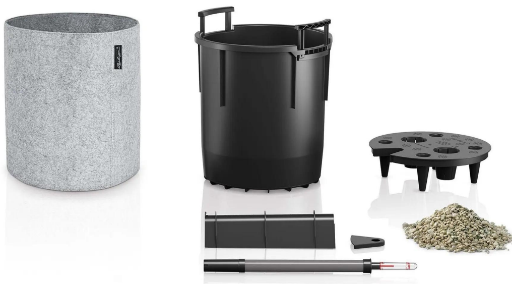
Doniczka Lechuza TRENDCOVER 32 filc jasnoszary - zestaw

Dokonując zakupu doniczki Lechuza Trendcover 32 otrzymujesz w zestawie osłonę, wkład z systemem nawadniania i niezbędną ilość granulatu Lechuza Pon.